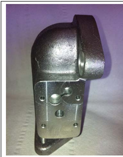
Neues Teil New part