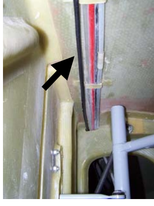
Antennenkabel verläuft parallel zu den Schlauchen und Leitungen an der linken Rumpfwand. Antennenkabel fixieren.